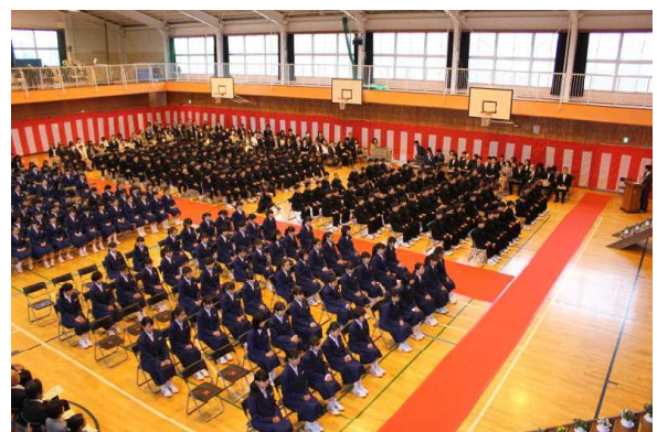
平成31年4月8日入学式

今年は、天皇陛下が御退位されるとともに、新天皇陛下が御即位され、新たな元号「令和」に変わる特別な年に当たります。御即位に際し、国民挙って祝意を示すため、「天皇即位の日」の5月1日と、「即位礼正殿の儀の行われる日」の10月22日が、今年に限り「国民の祝日」となります。皇太子殿下が御即位され、新たな元号「令和」になる今年は、私たち日本国民のとっても特別な年になることと思います。